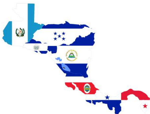
Países miembro de la COCATRAM y REPICA

No es un documento rígido, sino flexible y abierto que puede y debe ser modificado, implementado y completado según evolucionen las legislaciones ambientales y las prácticas del trabajo portuario, el comercio internacional y surjan nuevos aspectos ambientales y tecnologías que requieran ser atendidos, el Código forma parte de un proceso a largo plazo para mejorar los niveles de manejo ambiental en los puertos, a través del progresivo mejoramiento del trabajo portuario con relación al medio ambiente. El Código reconoce las oportunidades que ofrece la promoción del medio marítimo de transporte, incluido el cabotaje regional, a través de un trabajo portuario amigable con el ambiente.